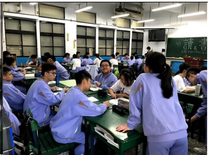
活動主題:高(國)中一、二年級第二次班級讀書會。