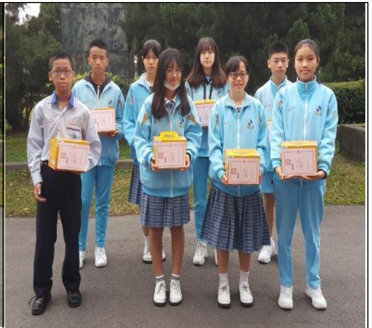
活動主題:班級書庫(讀書角)設置。