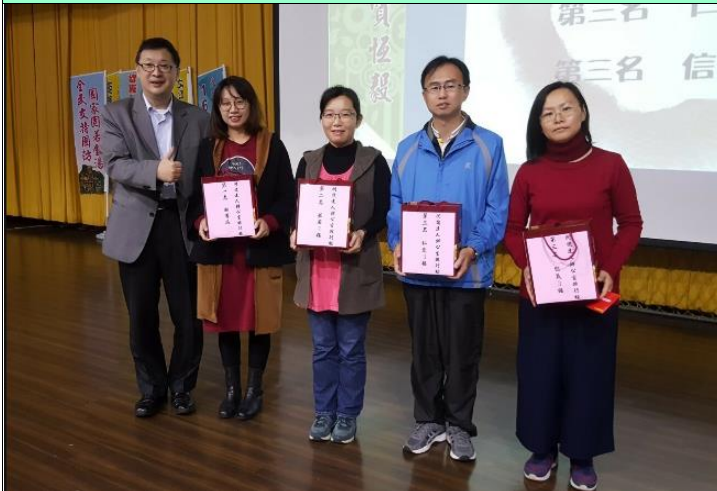
活動主題:悅讀達人獎-教師個人借閱排行。