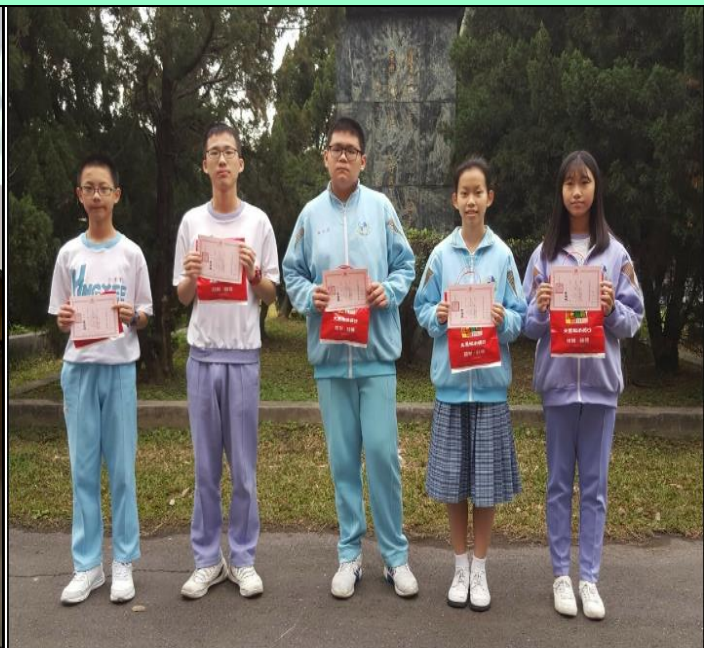
活動主題:悅讀達人獎-學生個人借閱排行。