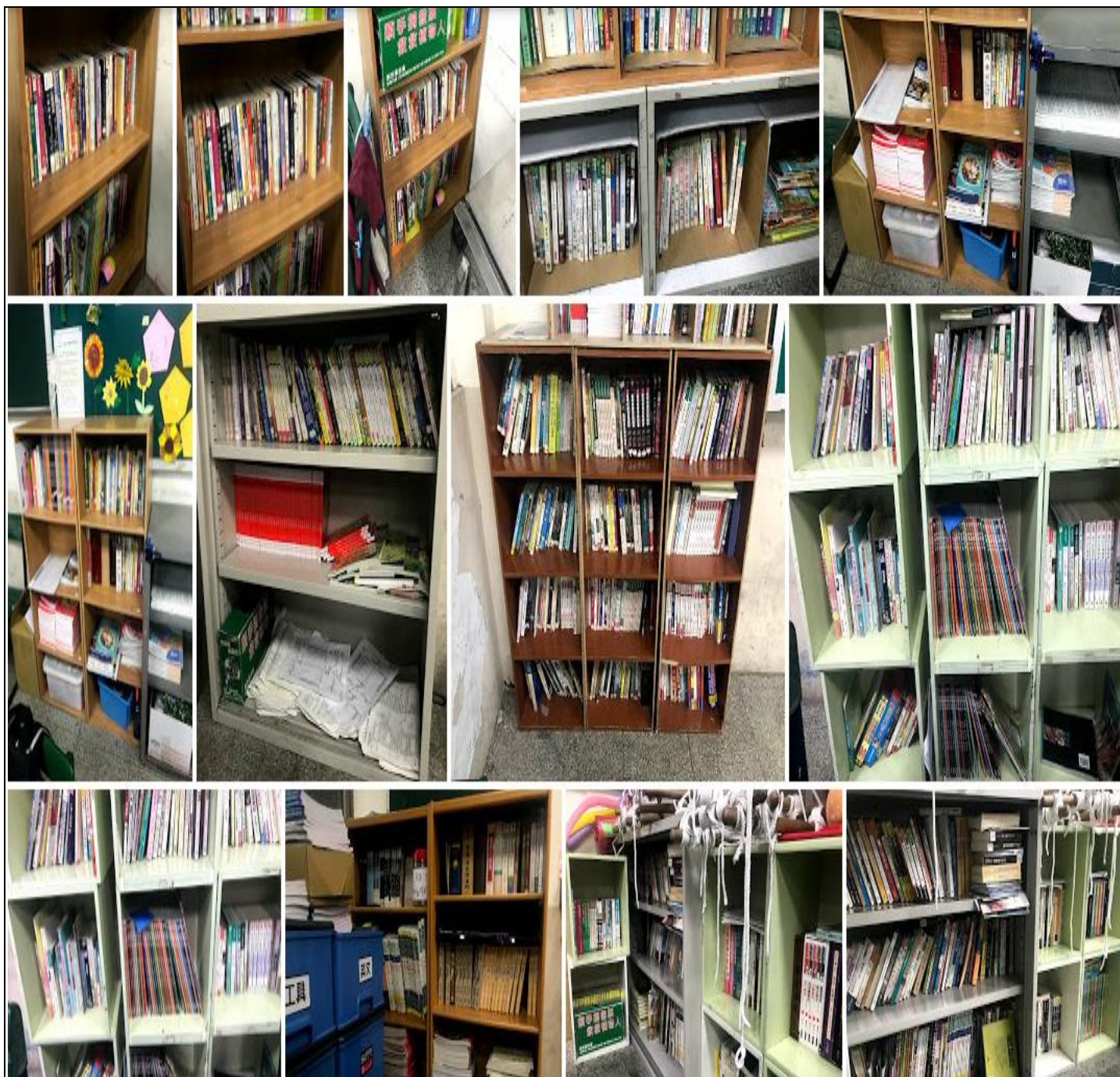
活動主題：班級書庫-設置優良頒獎。