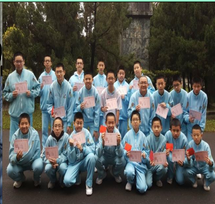
活動主題:辦理高中自主學習課程。