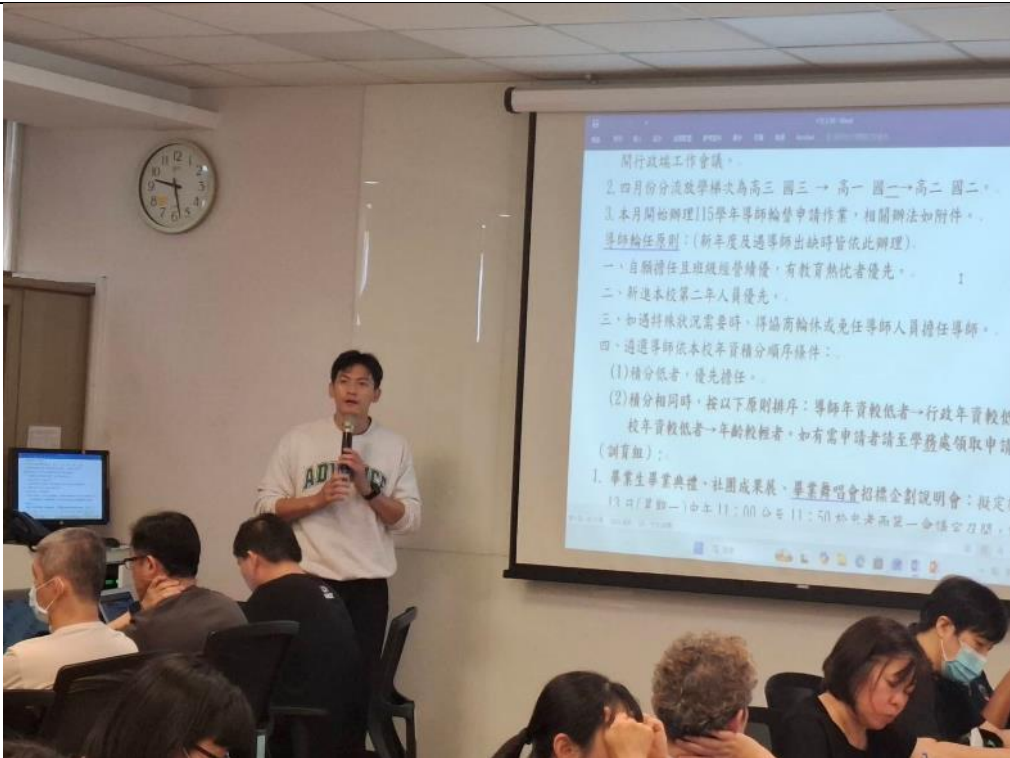
學 務 處 報 告