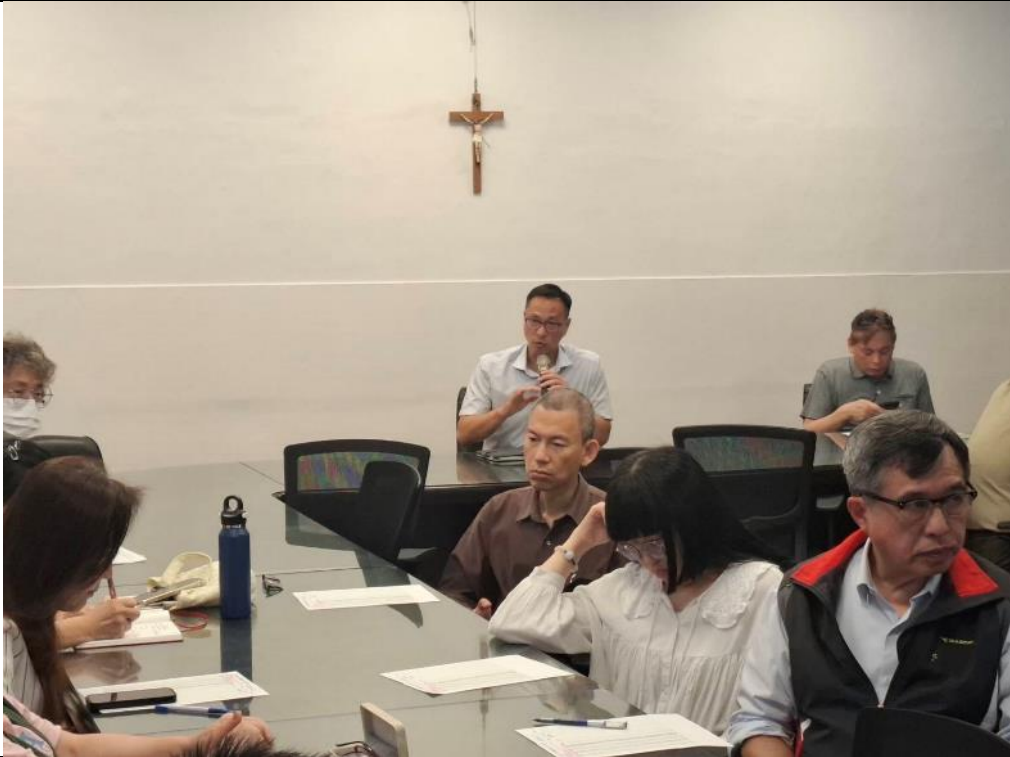
校 長 主 持 會 議