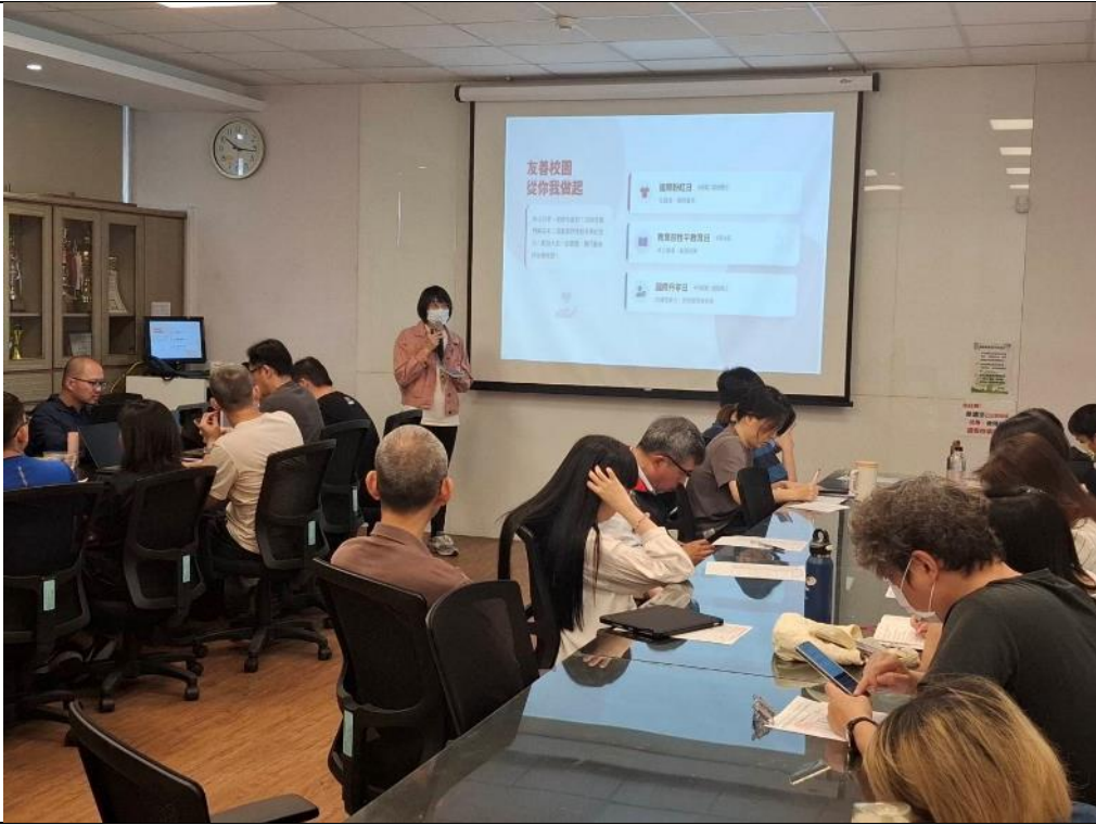
輔 導 處 報 告